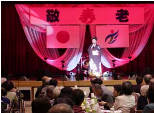
10.7 大紀町大内山地区敬老会