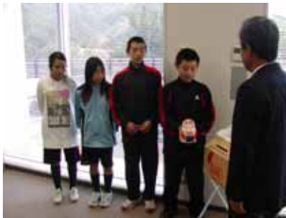
11月19日（水）集まった募金を届けて頂いた 錦小学校 児童会の皆さん

昨年の10月1日より11月30日まで赤い羽根共同募金一般募金運動が全国で実施され、本町でも各戸への呼びかけや小中学校への学校募金、街頭募金箱の設置等募金活動にご協力頂き誠にありがとうございました。