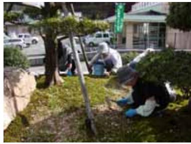
10.6 シルバー人材センター奉仕作業