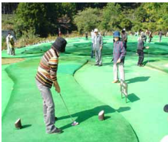
人工芝のグリーンは全天候型の設計