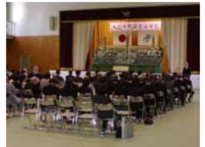
6.1 大紀町戦没者追悼式