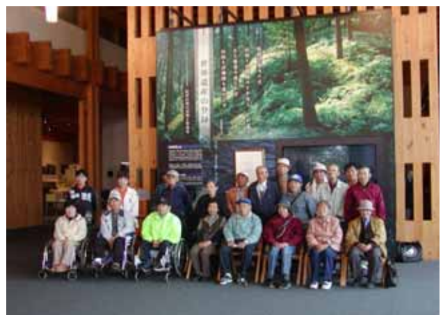
11.8 身体障害者交流会「熊野古道センター」