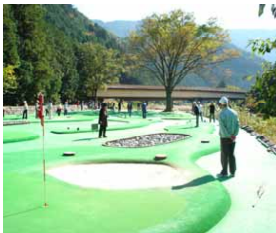
大内山松原親水公園パターゴルフ場の全景

11月 5日（水）12日（水）17日（月）20日（木）の4日間、大内山松原親水公園パターゴルフ場に於いて、町老人クラブ主催のパターゴルフ大会が開催され4日間を通して約200名の参加がありました。