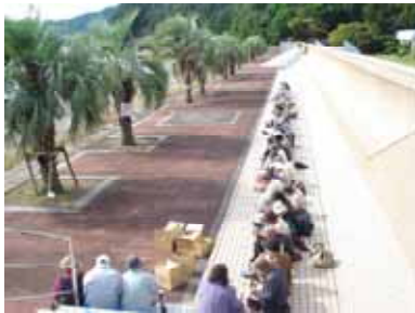
11.10 大内山地区ふれあい交流会

発行・編集 社会福祉法人 大紀町社会福祉協議会 〒519-2911 三重県度会郡大紀町錦 736-7 0598 (73) 3227 / FAX 0598 (73) 2278 URL http://www.taikishakyo.jp E-mail : taiki-sh@ma.mctv.ne.jp