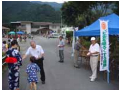
8.16 社会を明るくする運動