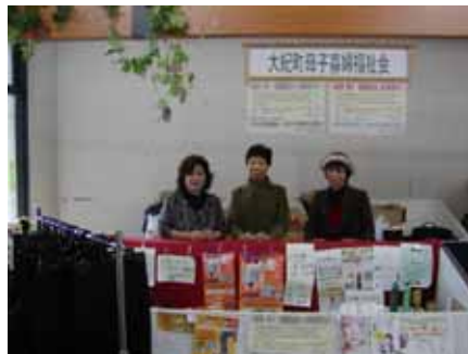
あたたかい雰囲気の山海の郷販売所