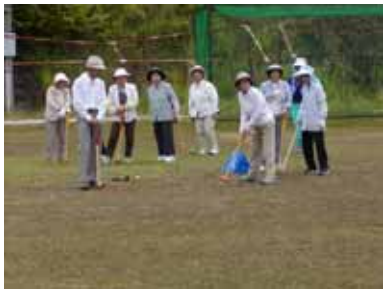
6.18 老人クラブグランドゴルフ大会