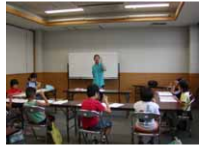
7.29 ボランティア手話体験教室