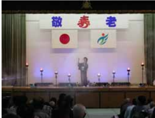
昨年の敬老会のひとこま

事業の遂行にあたり、各地区の民生委員さんを始め地域の多くのボランティアの皆様方のお力添えにより事業が充実し効果のあるものとなり感謝を申し上げます。ここに一年間の主な活動の一部を報告し、地域の皆様のご理解を頂くと共に、今後ともご支援ご協力いただきますようお願いいたします。