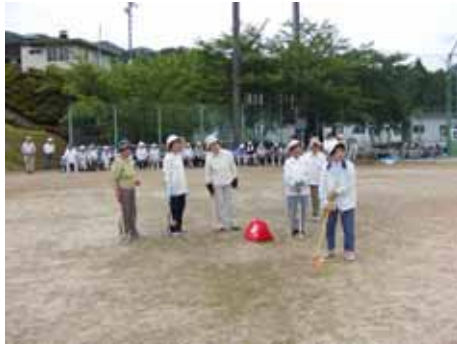
昨年度会費配分事業の高齢者健康事業より

本年も7月を社協会員募集月間として、大紀町内において『誰もが住み慣れた地域で、いつまでも安心して暮らせる福祉のまちづくり』を推進していく中で、住民相互の支えあいにより社会福祉協議会の運営並びに地域福祉の充実を進めていく為、会費の納入をお願いしております。