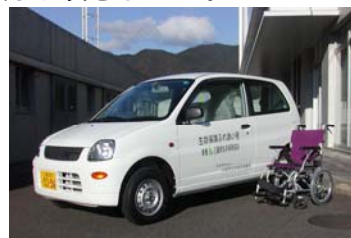
▲ご寄付頂いた車両と車椅子