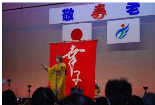
▲芸能アトラクションのようす

去る10月6日(水)・7日(木)の2日間、大紀町コンベンションホールで、70歳以上の対象者3,111名のうち、722名みなさんの参加により大紀町敬老会が盛大に開催されました。