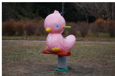
↑ 滝原公園内に寄贈した遊具 →

地域のみなさまから、これまでお寄せいただきました寄付金を活用して、滝原公園内に遊具2基と、町内の小学校、保育園にそれぞれ要望のあった遊具を寄贈させていただきました。